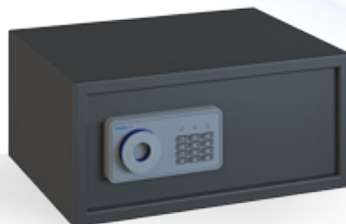
Modelo: Air: Laptop